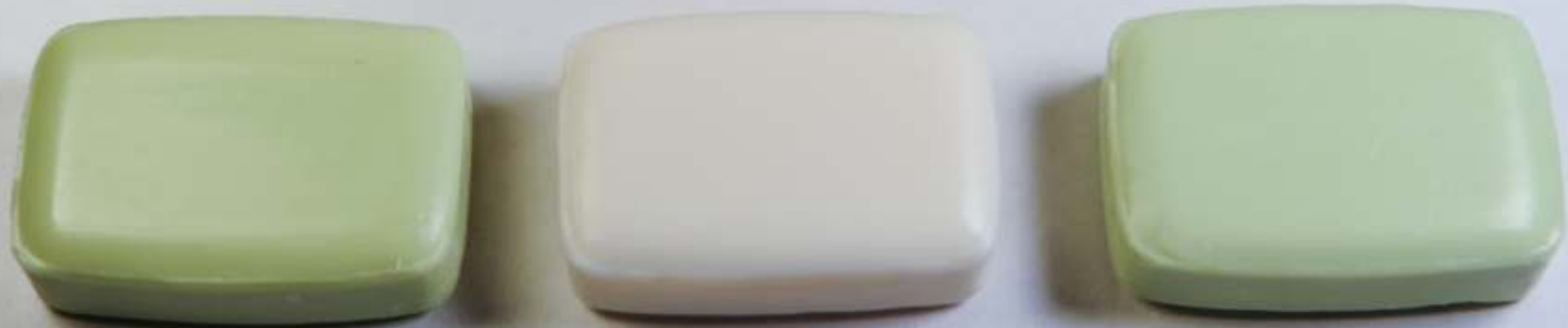
RECTANGULAR N° 1C: PASTILLA DE 20 GRS.